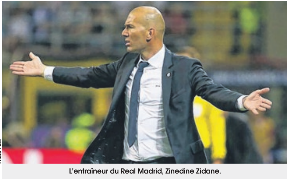
L'entraîneur du Real Madrid, Zinedine Zidane.

Quel a été pour vous le meilleur moment de 2016 ? Et le pire ?