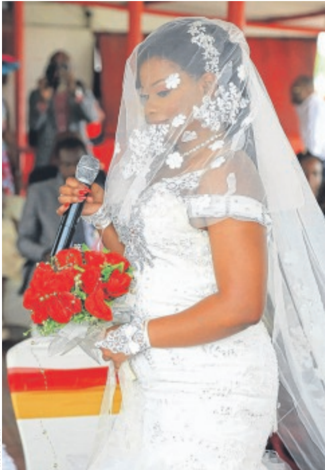
Le bouquet que tient la mariée le jour de son mariage est signe de fécondité.