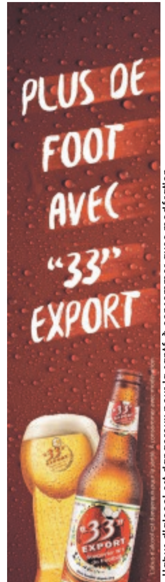
L'abus d'alcool est dangereux pour la santé à consommer avec modération