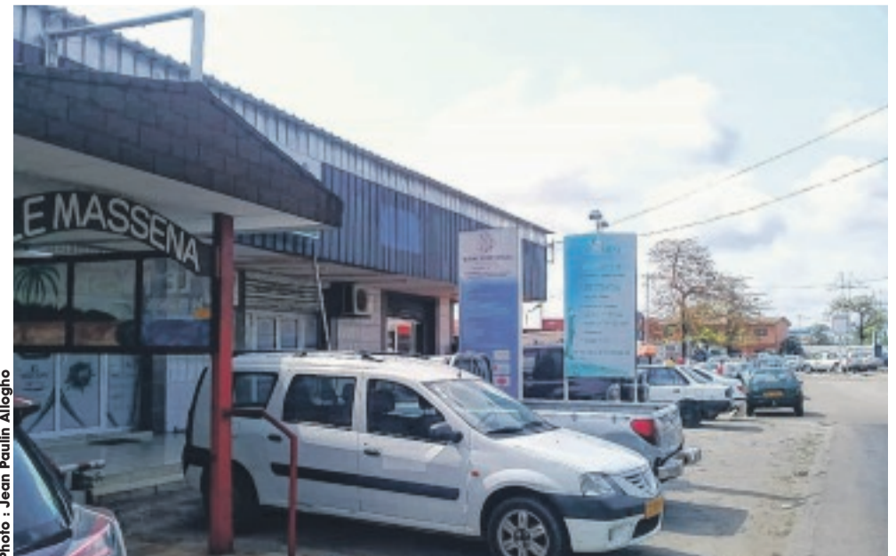
Le Massena, un des nombreux restaurants du Front de mer de la ville du sable.