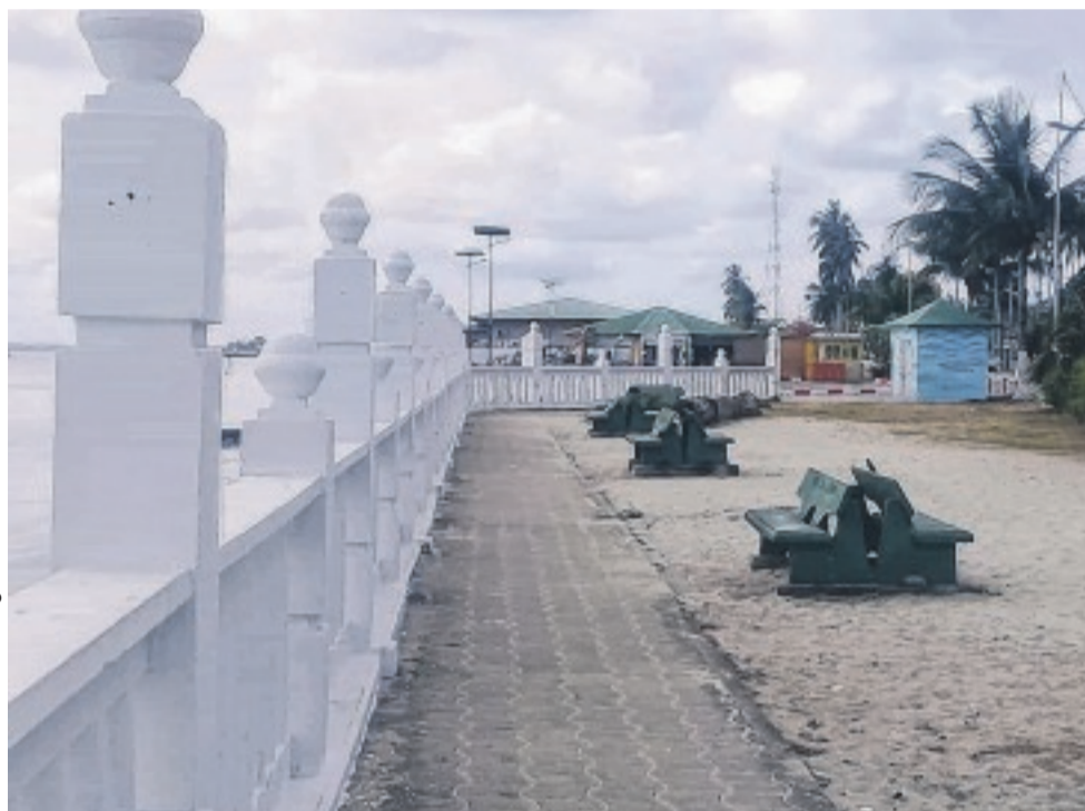
La façade maritime de Port-Gentil, un lieu idéal pour le divertissement.

A moins d'opter pour le restaurant municipal. Ou