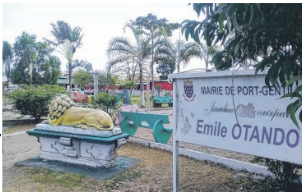
Le jardin municipal Emile-Otando prêt à recevoir les familles nombreuses.

C'est également comme si la ville s'éveillait au coucher du soleil. L'atmosphère est parfaite et contagieuse à l'avènement de la nuit. Les cafés et magasins attendent l'arrivée du coucher de soleil et de la nuit. Mais aussi des clients.