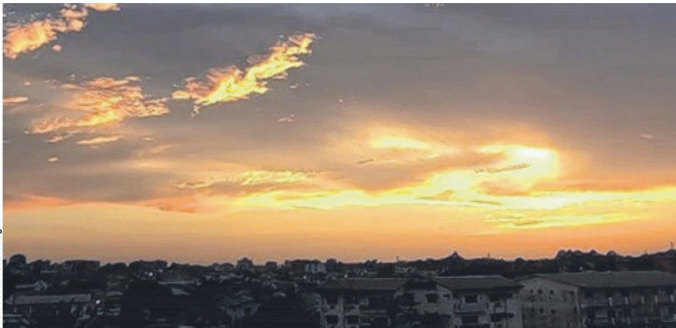
Une vue du coucher du soleil à Port-Gentil.