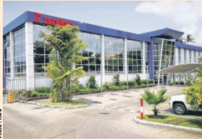
le siège de l'Union, journal à l'honneur du 1er Forum.

et journalistes autour de l'initiative " La Ceinture, La Route ". L'un des objectifs immédiats de ce forum sera probablement la création de cette instance. De manière pratique, cette édition du Forum national des médias et journalistes du Gabon comprendra cinq communications destinées à vulgariser cette initiative économique (Lire ci-dessous) et d'outils d'aide à la décision. « Il ne s'agira pas de donner du poisson, mais