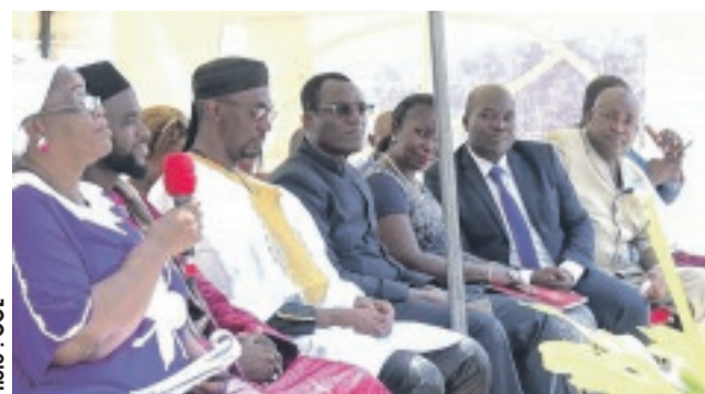
Vue partielle des participants au symposium.

tique susceptible de garantir la vitalité et la préservation du patrimoine linguistique national.