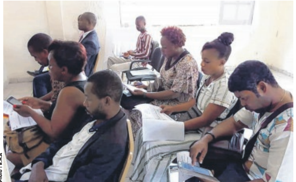
...aux membres de la presse locale.