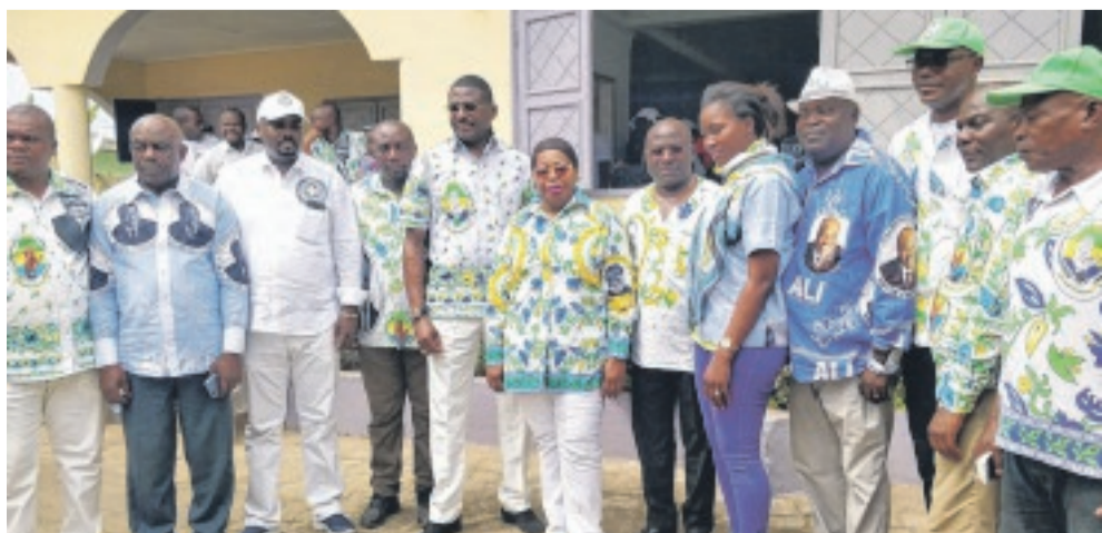
Les responsables du PDG du 2e arrondissement d'Owendo.