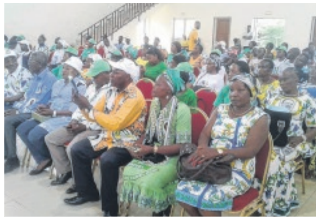
Une vue des militants au week-end politique de Cocobeach.