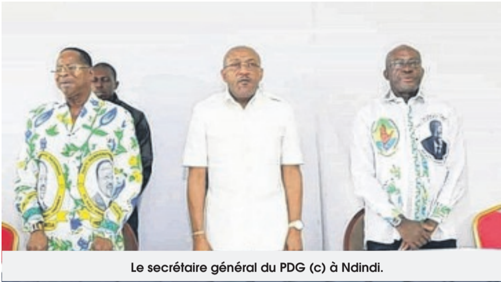
Le secrétaire général du PDG (c) à Ndindi.

LE périple des membres du secrétariat exécutif du Parti démocratique gabonais (PDG) s'est poursuivi, jeudi 4 juillet dernier, à Ndindi, dans le département de la Haute-Banio. "Une terre tout acquise au PDG et à son distingué camarade président Ali Bongo Ondimba", comme l'a dit le secrétaire départemental. Selon lui, l'attachement des militants, militantes et des populations de cette localité à Ali Bongo Ondimba ne "souffre d'aucune ambiguïté". Il ne saurait en être autrement. Car, a-t-il avancé, depuis 2009,