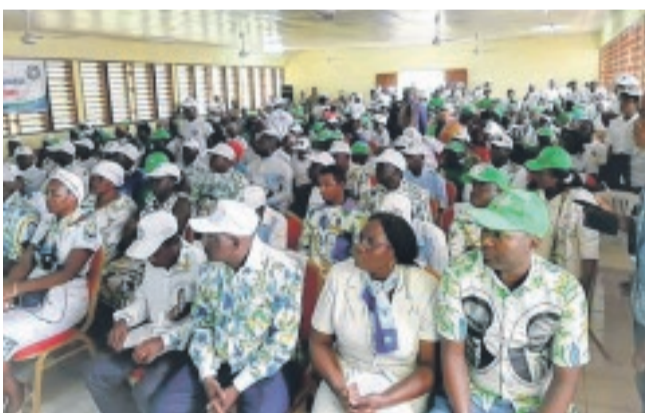
Une vue des militants de Moabi.