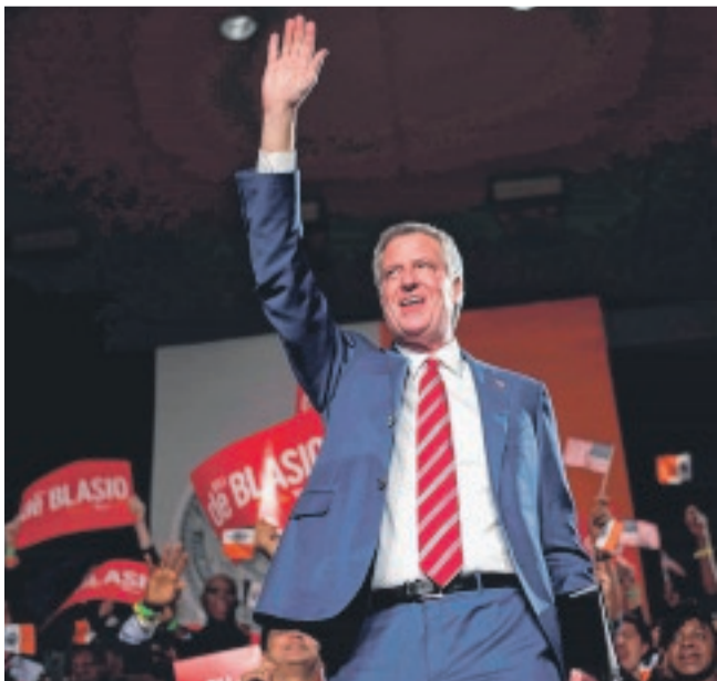
Avec moins de 0,5% dans les sondages, Bill de Blasio a dû se résoudre à abandonner la course à l'investiture démocrate.

des pré-sondages déjà décourageants et un scepticisme largement partagé tant par les médias que par les experts politiques, y compris dans son entourage. Même si son poste lui conférait une notoriété immédiate, il n'a jamais suscité d'élan populaire. "Le maire de New York à temps partiel, Bill de Blasio, qui avait un solide score de 0% dans les sondages mais avait une marge de progrès, a, à la surprise générale, abandonné la course à la présidentielle. La ville de New York est dévastée !", a ironisé Donald Trump sur Twitter. Début septembre, après avoir été écarté du débat démocrate du 12 septembre, M. de Blasio avait déjà ouvert la porte à un abandon, au cas où les sondages ne s'amélioreraient pas. "Je vais essayer d'être dans les débats d'octobre (...) Si je n'y arrive pas, ce sera très difficile de concevoir de continuer", avait-il alors déclaré. Plusieurs candidats démocrates se sont retirés de la course à l'investiture ces dernières semaines, mais ils sont pour l'instant encore 19 en lice pour déterminer qui affrontera le président républicain en novembre 2020. Trois candidats sont à ce stade dans le peloton de tête : l'ancien vice-président Joe Biden, la sénatrice du Massachusetts Elizabeth Warren et le sénateur du Vermont Bernie Sanders.