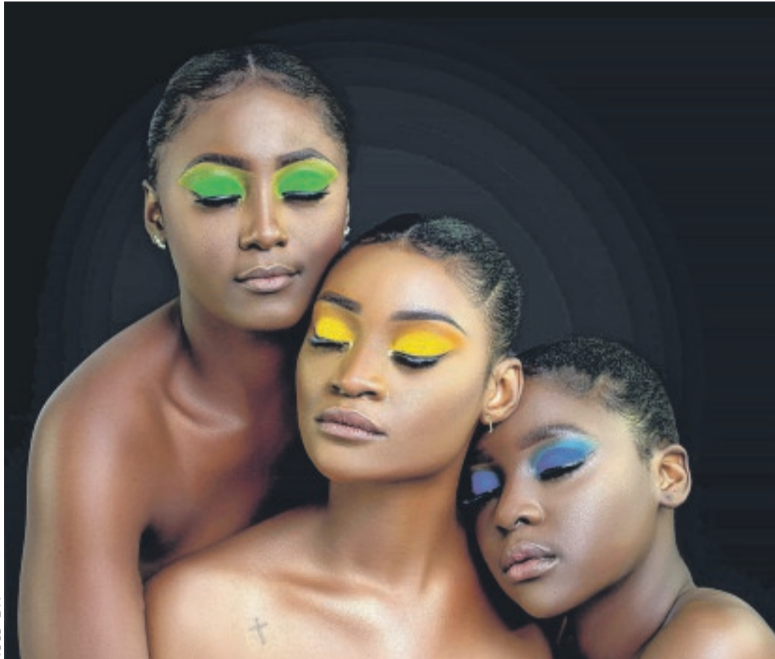
«Autour de nos couleurs»: sublime mariage de la photographie et du Make-up.

Sur les mannequins qui ont permis la mise en œuvre de ce concept, les couleurs de notre drapeau étaient visibles. "La Krikri" a usé de ses doigts de fée et ses pinceaux pour exprimer le look vert-jaune-bleu de notre mère patrie. Paillette dorée, contours tricolores sur les yeux, buste repeint... La dame aux pinceaux a sublimé une vingtaine de personnes à l'occasion de cette journée thématique. "Nous avons démon-