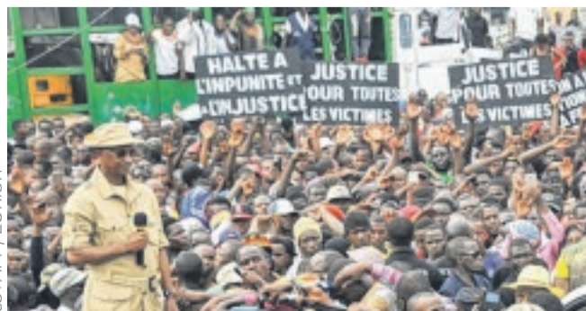
Le leader de l'opposition, Cellou Dalein Diallo.