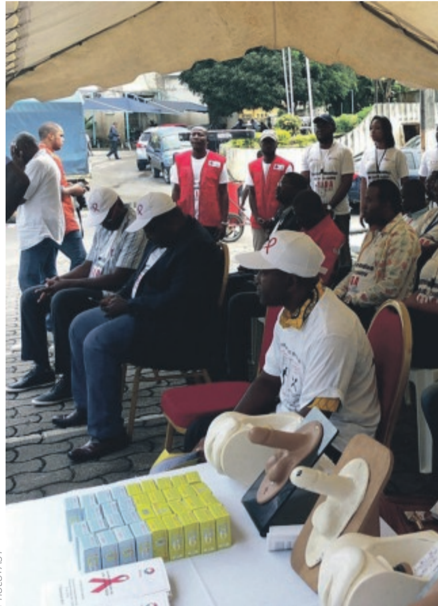
Si le Gabon a fait des progrès dans sa riposte au VIH, il existe une aug

La célébration, ce mardi 1er décembre 2020, de la 33e édition de la Journée mondiale de lutte contre le VIH, sous le thème national "La responsabilité de chacun et les efforts pour tous pour lutter contre le VIH/Sida et les IST", sera la bonne occasion pour les autorités sanitaires d'affiner les stratégies, tout en veillant à l'arrimage à la déclinaison des ODD (Objectifs du développement durable) dont le numéro 6 vise à combattre le VIH/Sida, le paludisme et les autres maladies.