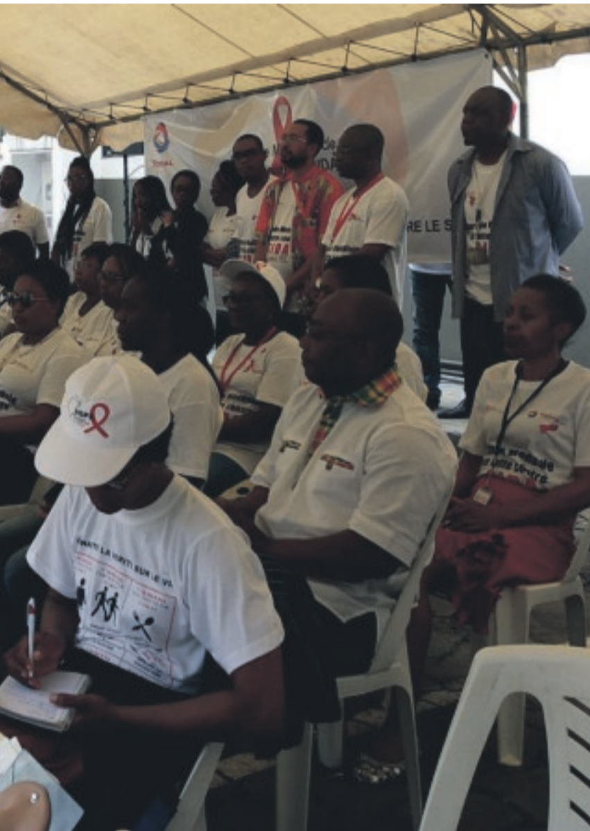
mentation inquiétante des décès liés au Sida chez les adolescents.

lisés. Les répercussions du Covid-19 sur les vies en général, et sur la riposte au Sida, devraient amener les acteurs de la lutte contre cette maladie et les plus hautes autorités à agir vite. Si rien n'est fait, " la riposte au sida pourrait connaître un bond en arrière de 10 ans si la pandémie de Covid-19 interrompt gravement les services de lutte contre le VIH ", prévenait le Programme commun des Nations unies contre le VIH/Sida (Onusida) lors de son dernier rapport mondial. Il y a donc urgence à agir !