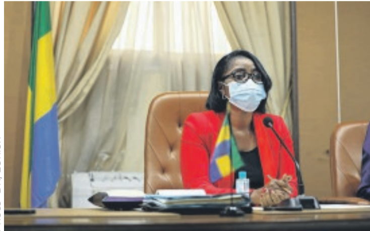
La Première ministre lors d'une précédente réunion.

tiane Ossouka Raponda fait suite à celle avec les gouverneurs de province le 26 janvier passé. L'objectif étant "d'avoir une parfaite coordination dans la riposte au niveau national et local", avait souligné la Première ministre sur sa page Facebook.