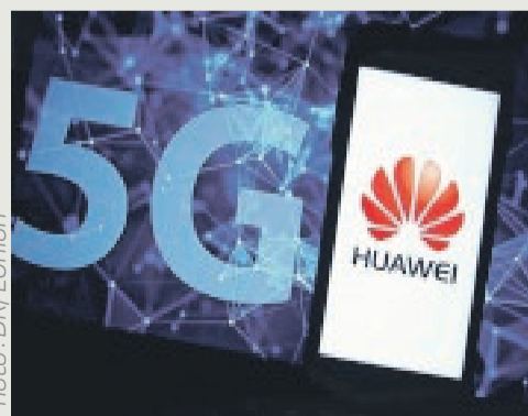
Les brevets 5G, une manne pour Huawei.

accru de près de 20 % le nombre de brevets déposés en 2020, dépassant la barre des 100 000 (85 000 en 2019). Rien qu'en Europe, il a déposé 3 113 brevets. Il est juste devancé par Samsung (3 276 titres) sur ce continent. Sa position dominante sur le plan international lui permet alors de dicter sa loi à ses autres concurrents. "Huawei va réclamer des royalties pour leur utilisation à Apple, Samsung et d'autres fabricants de smartphones. Le groupe chinois a annoncé qu'il allait négocier les tarifs et de potentielles licences croisées avec les fabricants. Le montant sera plafonné à 2,50 dollars par téléphone", nous informe igen.fr. Un montant relatif aux frais de brevets et de licences entre 2019 et 2021, explique le site clubic.com. Ce qui devrait lui rapporter 660 à 715 milliards de FCFA, sur la