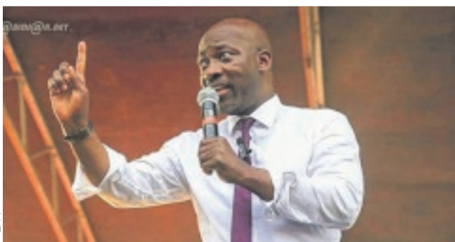
Charles Blé Goudé s'exprimant devant les militants venus l'accueillir.

Charles Blé Goudé n'a cessé de désigner sa montre du doigt devant la foule en délire. Une manière de lui dire que l'heure des retrouvailles était enfin arrivée, après une décennie de séparation. Le président du Cojep promet un meeting politique " dans quelques semaines " pour, assure-t-il, parler de toutes les questions qui préoccupent les Ivoiriens.