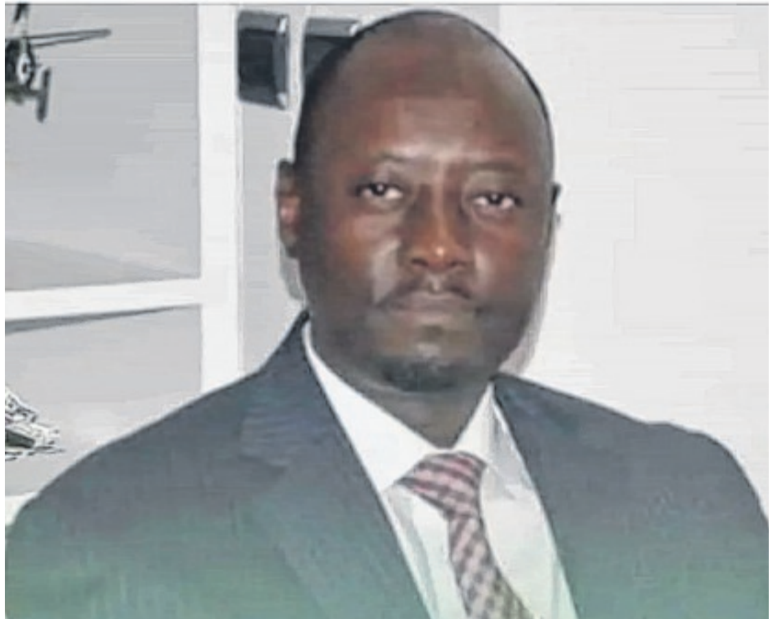
La page Facebook Global Investissement est à craindre, elle usurpe la photo du Gouverneur de la BEAC pour attirer des pigeons à déplumer financièrement.

Et le communiqué d'ajouter : "Des individus mal intentionnés contactent, actuellement, des particuliers ou des entreprises via des comptes frauduleux sur les réseaux sociaux, notamment Facebook, WhatsApp et LinkedIn, à des