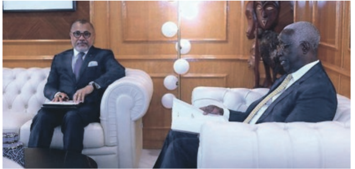
Le Premier ministre, Raymond Ndong Sima, s'entretenant avec la délégation de la BAD.

La délégation de la BAD a également eu une séance de travail avec le ministre de l'Économie et des Participations, Mays Mouissi, sur la normalisation des relations avec