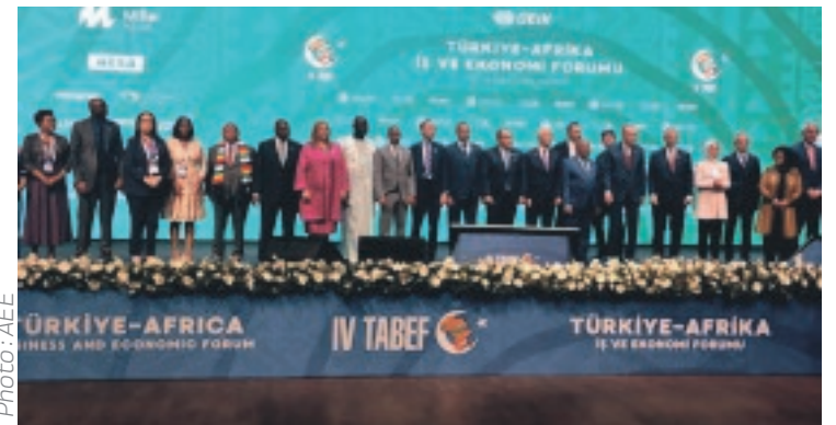
Les participants au 4e forum économique et commercial Afrique-Turquie à Istanbul.

Turquie-Afrique sous le thème : "Relever les défis, libérer les opportunités : renforcer les partenariats économiques entre l'Afrique et la Turquie". Coorganisée par le ministère du Commerce de la Turquie et l'Union africaine (UA), cette rencontre avait pour but l'identification des engagements futurs possibles pour le partenariat Turquie-Afrique en lien avec le commerce et les investissements ; la canalisation du secteur privé turc et des pays africains vers des partenariats commerciaux, industriels et technologiques à grande échelle ; et l'accroissement de l'interaction entre les milieux d'affaires